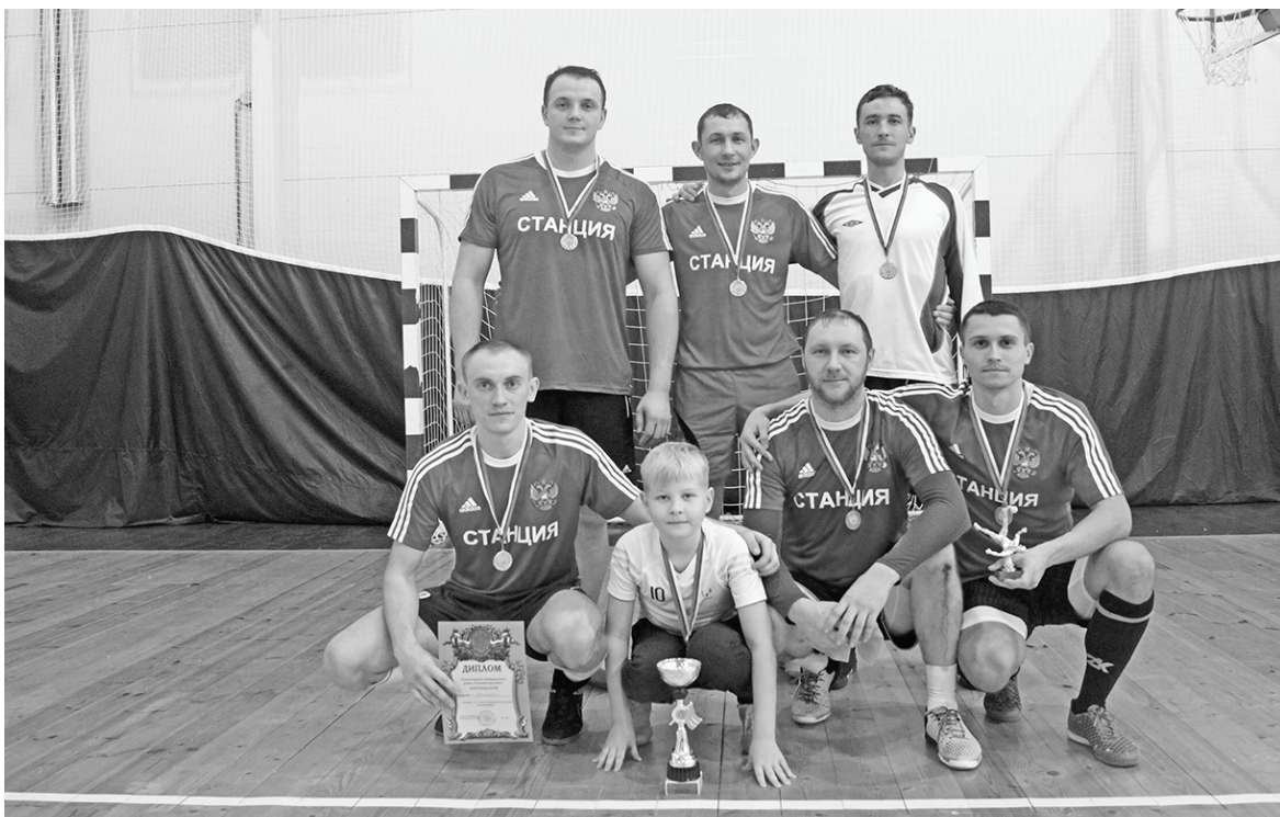
Победители турнира по мини-футболу - боевая команда станции Думиничи.